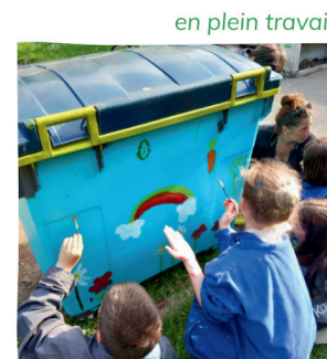
Lors du chantier, nous avons été interviewés par le journaliste de « Radio Harmonie ».