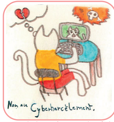
Le logo retenu pour le gobelet

Nous sommes heureux de pouvoir vous montrer le résultat obtenu. (distribution des gobelets)