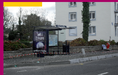
Arrêt bus rue Max Jacob avant la mise aux normes

Les arrêts bus de la commune sont en cours d'adaptation pour les personnes handicapées de manière à leur faciliter la montée et la descente dans les bus. Les arrêts ayant été mis aux normes en 2011 ou devant l'être en 2012 sont ceux du bourg de Beuzec, bourg de Lanriec, Keramporiel, du Port, de l'Avenue Pierre Guéguin, du collège du Porzou et du Cours Charlemagne, de Petit Kerambrigant, de la rue Max Jacob, de la rue de Quimper.