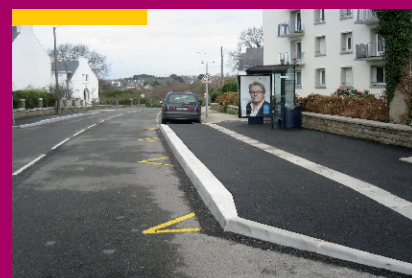
Arrêt bus rue Max Jacob après travaux de mise en accessibilité PMR