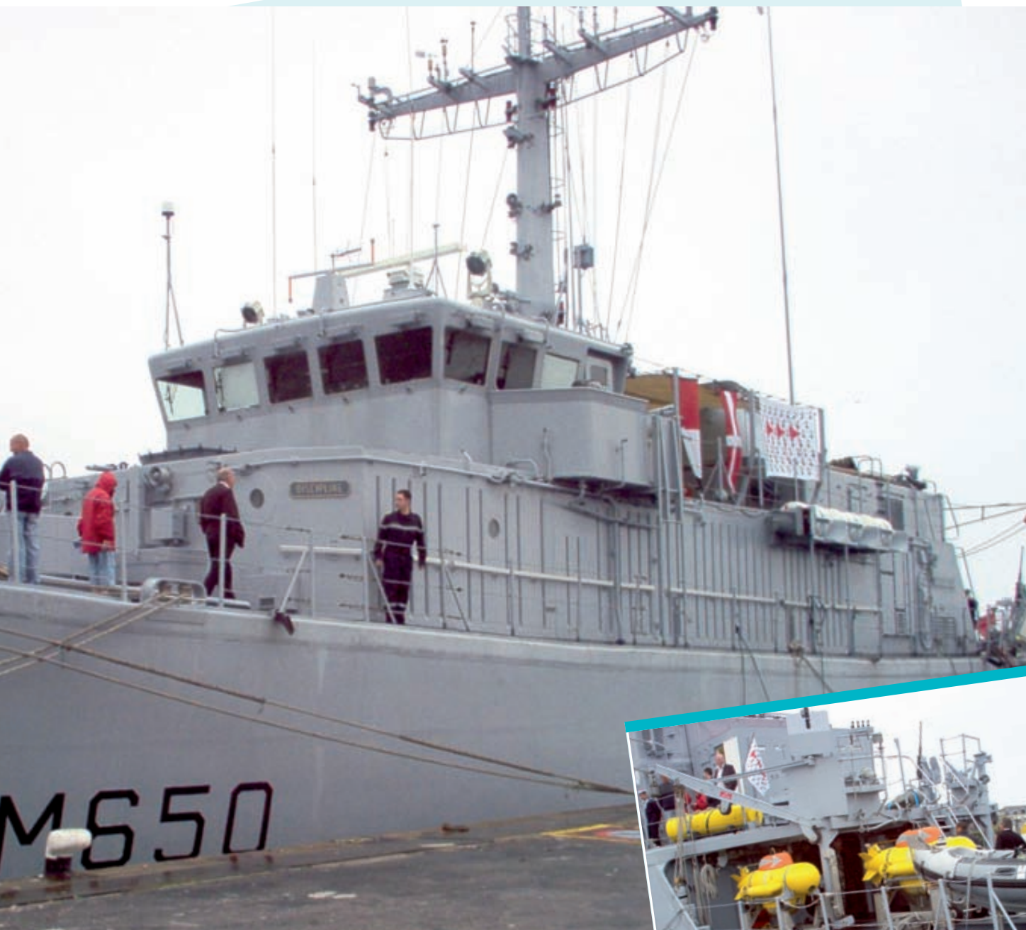
Le Sagittaire en visite à Concarneau.

à bord, interventions dans les écoles, compétitions sportives, toutes occasions pour la Ville de rapprocher les citoyens de leur armée. Offrant à tous l'opportunité de rencontrer de façon conviviale les hommes et femmes chargés de leur défense, ces rendez-vous permettent aux jeunes, en particulier, de découvrir la Marine nationale et ses nombreux métiers.