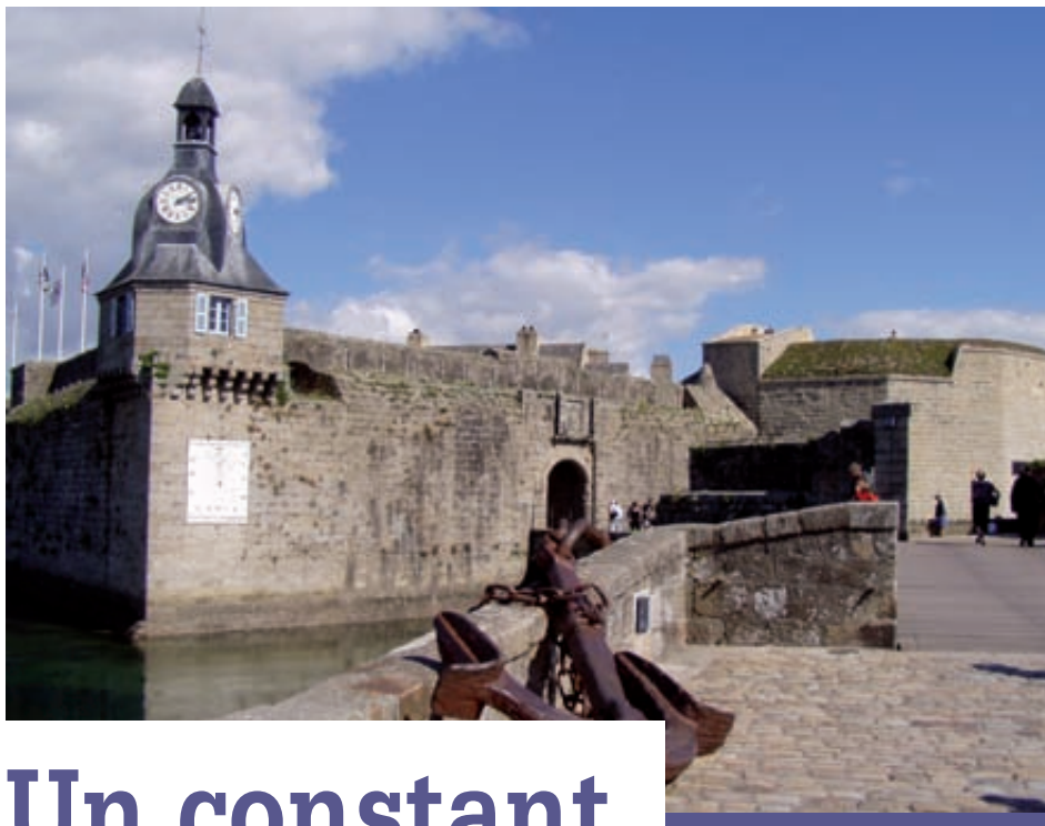
Le pavage de la Ville close est inscrit aux investissements 2011.