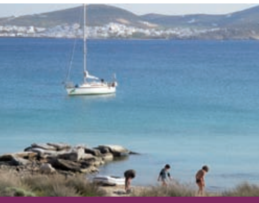
269 jours d'aventure en Méditerranée.

Canal du Midi, cap d'Agde, Marseille... Puis l'échappée vers la Corse, la Sardaigne, Delphes, Ephèse, le golfe de Corinthe, les Cyclades, la côte turque. Au fil de cette odyssée, des amitiés se sont nouées, les personnalités se sont affirmées.