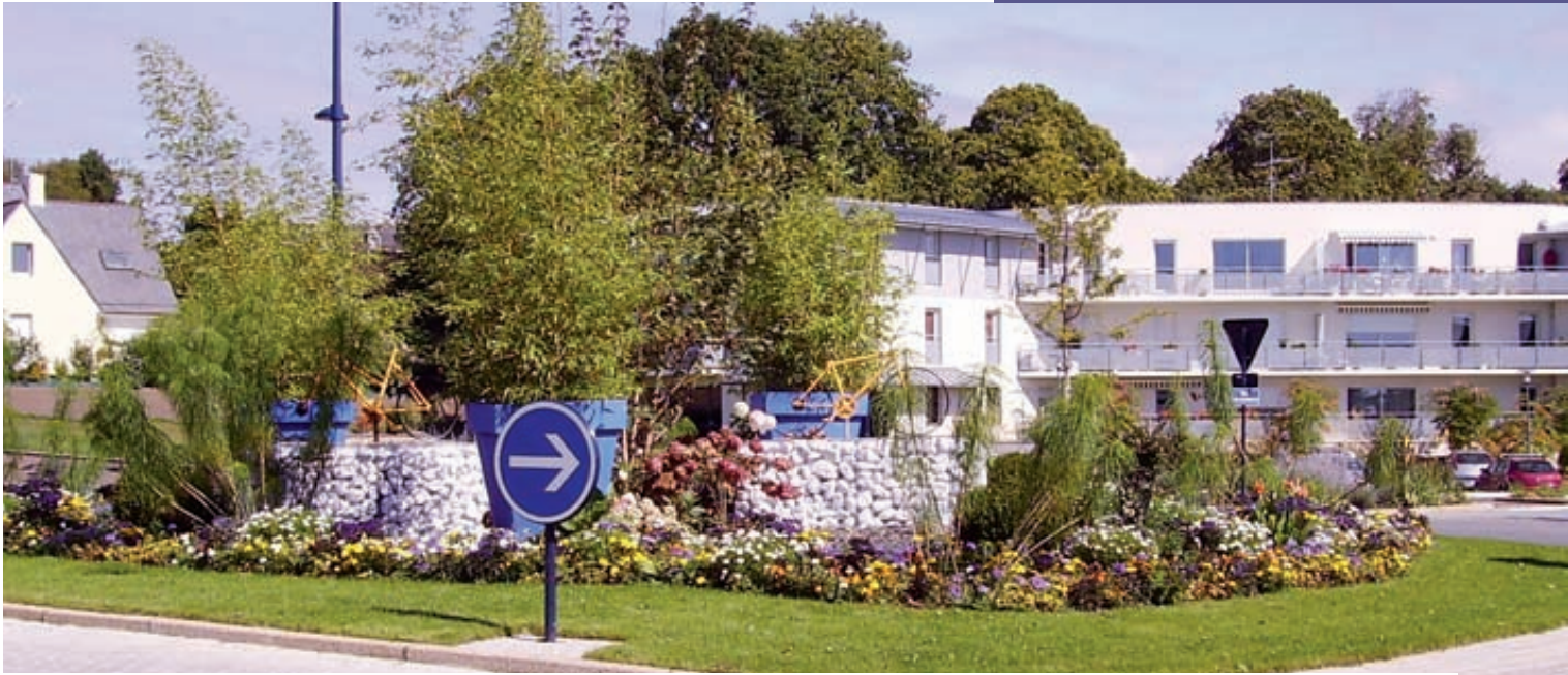
Le rond-point de Kerneac'h.