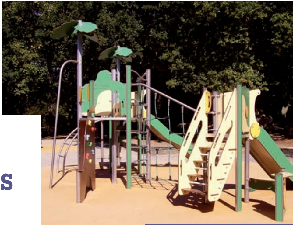
L'aire de jeux du bois de Porzou.

Observatrice attentive de son environnement et des améliorations qu'il réclame, l'équipe municipale est également à l'écoute des besoins exprimés : des besoins relayés par différents intermédiaires, dont les comités de quartiers.