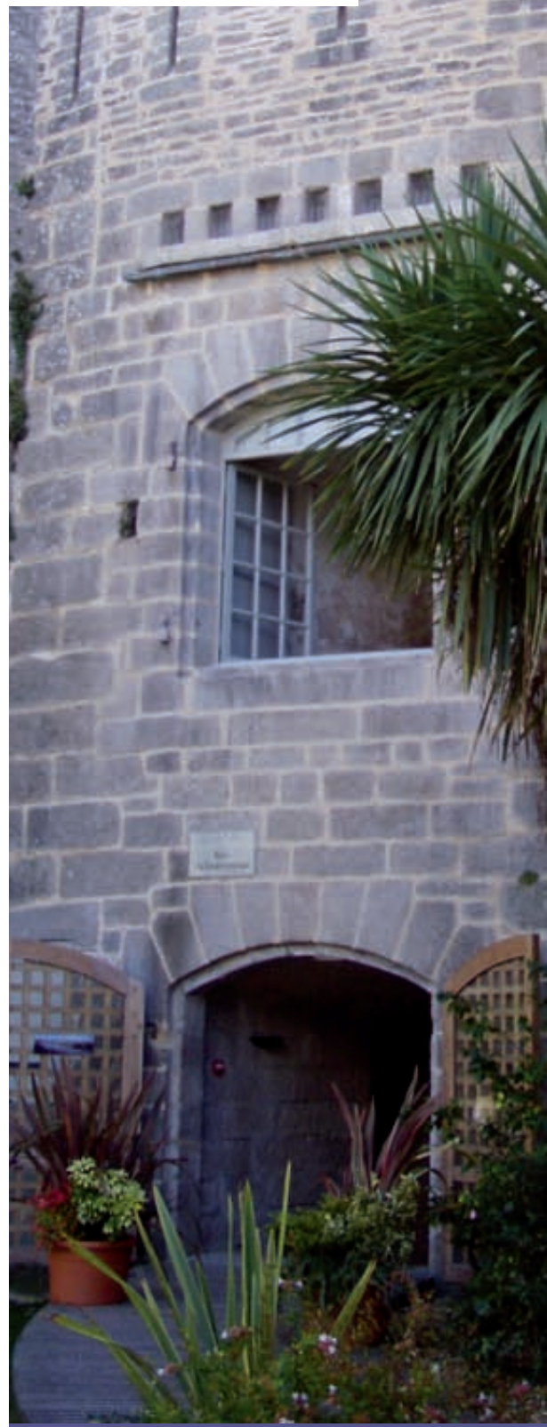
L'entrée de la tour du Gouverneur.

À noter que ce nouveau pavage ne posera pas de problème aux personnes à mobilité réduite.