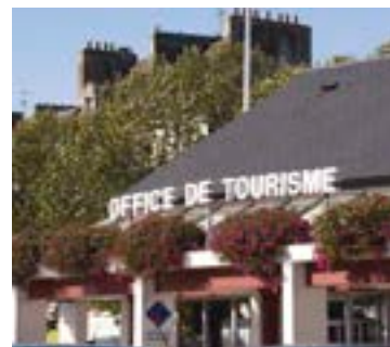
Office de tourisme

Office de tourisme, Quai d'Aiguillon. Tél. 02 98 97 01 44 www.tourismeconcarneau.fr