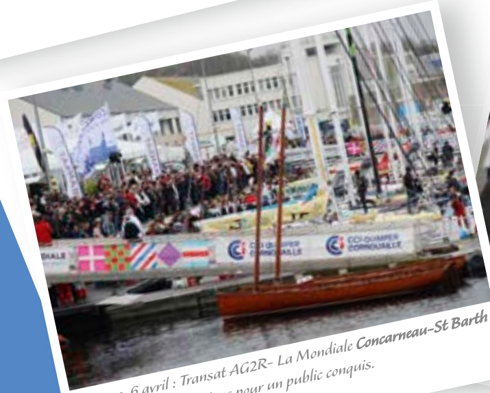
29 mars-6 avril : Transat AG2R- La Mondiale Concarneau-St Barth : une semaine d'animations pour un public conquis.