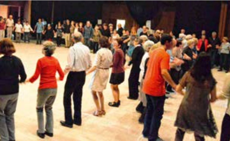
Le grand fest-deiz organisé par l'AVF Concarneau, en avril, pour ses 40 ans a connu un vif succès.