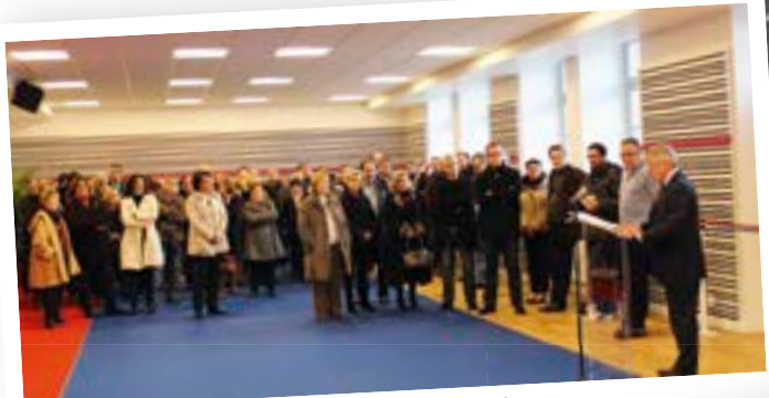
28 février - Ferme du Moros : nouveau centre de danses et musiques traditionnelles et modernes.