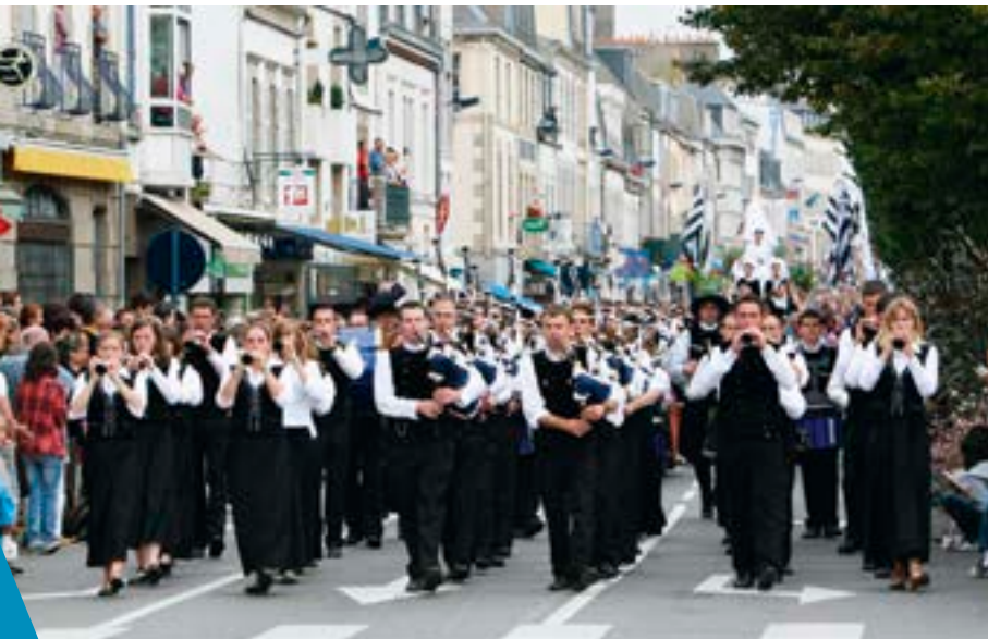
Le bagad de Concarneau