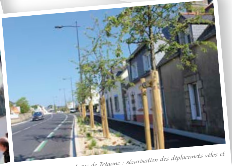
Avril - Aménagement rue de Trégunc : sécurisation des déplacements vélos et piétons.