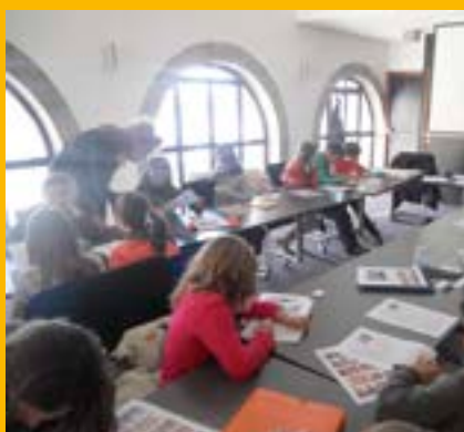
Concentration sur le quiz.

rel, Maison du patrimoine, CAC, École de musique, bibliothèque et ses archives, collection municipale de tableaux).