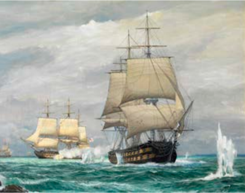
Charles Viaud, le Vétéran . Huile sur toile, Collection Musée de la Pêche, Concarneau.