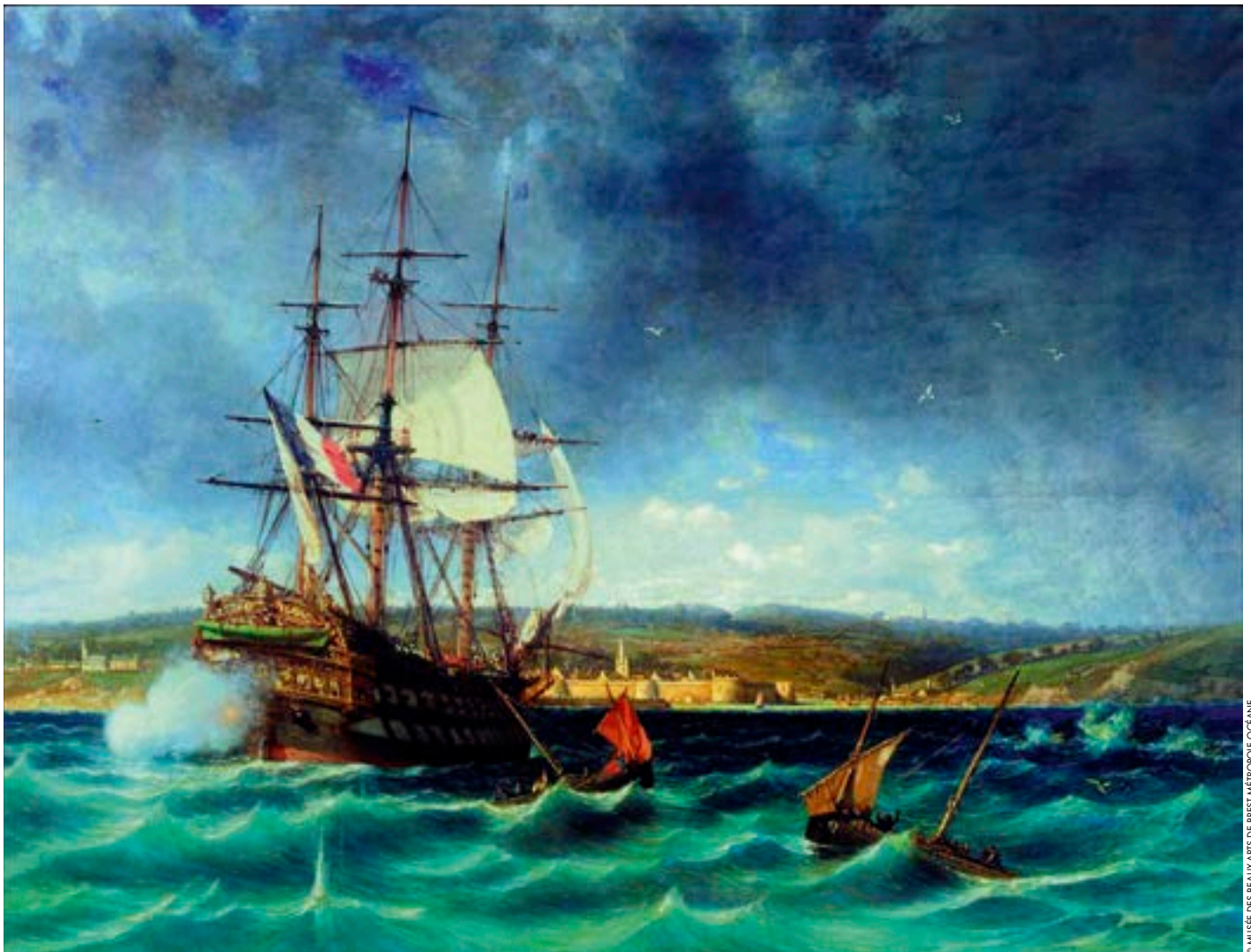
Le Vétéran entrant à Concarneau en 1806. Michel Bouquet vers 1861.

*"Le vaisseau Le Vétéran " de Jean Allouis et " Concarneau, histoire d'une ville " de Louis-Pierre Le Maître, deux ouvrages à consulter aux archives municipales et à la bibliothèque du Musée de la pêche.