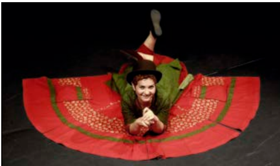
La comédienne Guylaine Kasza

Programme détaillé : www.lechienjaune.fr