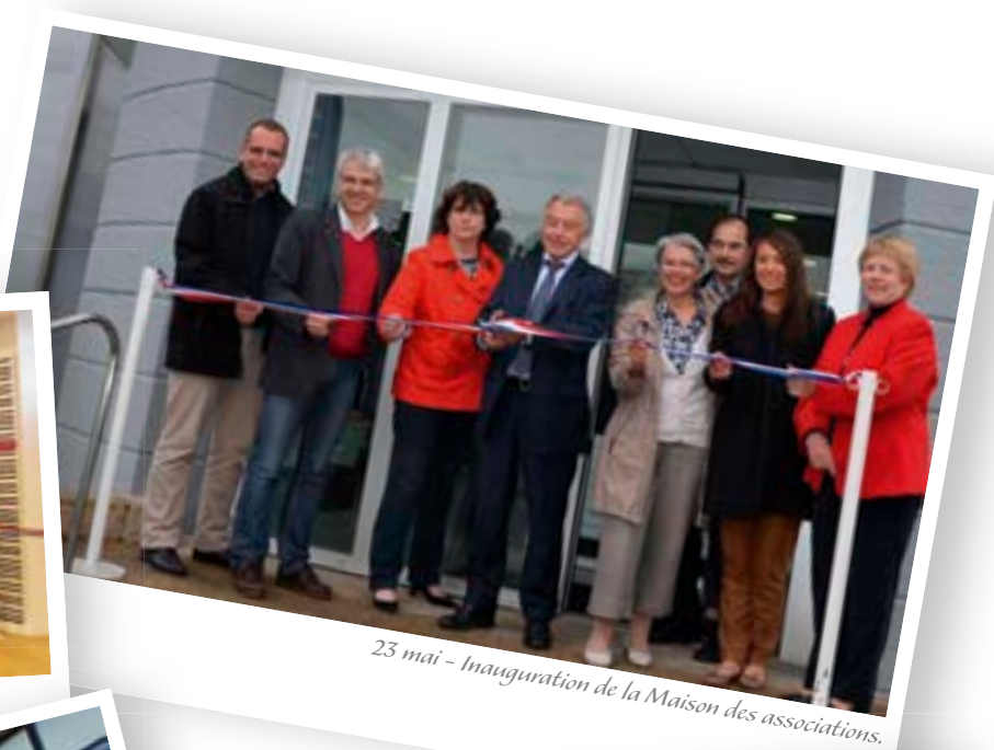
23 mai - Inauguration de la Maison des associations.