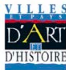
Label "Ville d'art et d'histoire"

La reconquête de ce label obtenu en 2002 est en cours. Projet de développement culturel à destination non seulement des vacanciers mais aussi du public local des adultes, familles et scolaires, le label a permis d'élargir l'éventail des visiteurs intéressés plus particulièrement par le patrimoine, et de prolonger la saison touristique. Il conforte la qualité de l'offre de la ville avec notamment des visites réalisées par des guides agréés par le ministère de la Culture. Il aura également favorisé l'ouverture de nouveaux équipements comme la Maison du patrimoine en Ville Close.