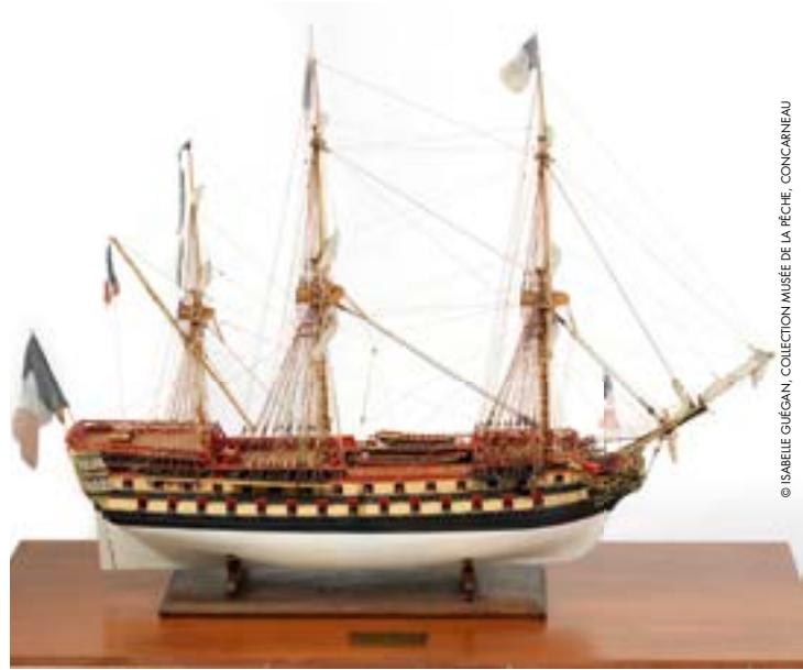
Louis Levasseur, Vaisseau le Vétéran , Collection Musée de la Pêche, Concarneau.

Durant trois ans, de 1806 à 1809, le port de Concarneau a abrité le Vétéran , navire de guerre français, la flotte anglaise postée au large de l'archipel des Glénan lui refusant toute sortie. L'événement ne fut pas sans conséquence sur la vie quotidienne de la population concarnoise.