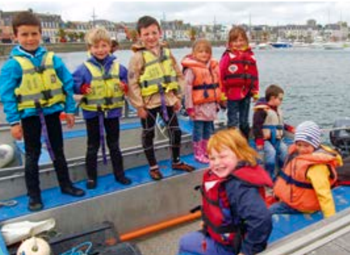
Les 4-6 ans quittent les pontons du port de plaisance pour relever les casiers immergés dans la baie.

Harnachés de pied en cap, les apprentis navigateurs sont prêts à monter à bord de leur catamaran KL 10,5.