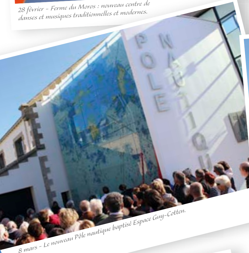
8 mars - Le nouveau Pôle nautique baptisé Espace Guy-Cotten.