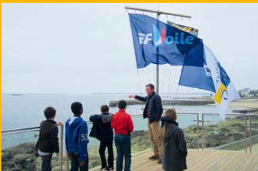
Vue imprenable du plan d'eau depuis la terrasse.

Au cours de cette visite, nous avons pu découvrir les différents espaces : zone humide, zone sèche, vestiaires, hébergement, salles de réunion, espaces conviviaux, la terrasse pour les départs de régates et la surveillance du plan d'eau... Ce très bel outil va permettre de promouvoir la voile à Concarneau et d'y organiser de belles courses.