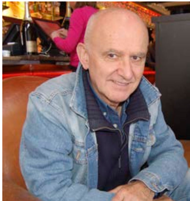
“Ma musique est tout ce que je suis, tout ce que j’aimerais être”.