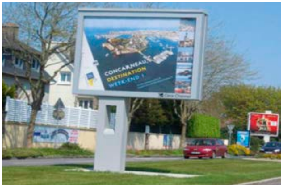
La campagne d'affichage, orchestrée par la Ville dans les villes du grand Ouest, contribue à promouvoir Concarneau.

La reconquête de ce label obtenu en 2002 est en cours. Projet de développement culturel à destination non seulement des vacanciers mais aussi du public local des adultes, familles et scolaires, le label a permis d'élargir l'éventail des visiteurs intéressés plus particulièrement par le patrimoine, et de prolonger la saison touristique. Il conforte la qualité de l'offre de la ville avec notamment des visites réalisées par des guides agréés par le ministère de la Culture. Il aura également favorisé l'ouverture de nouveaux équipements comme la Maison du patrimoine en Ville Close.