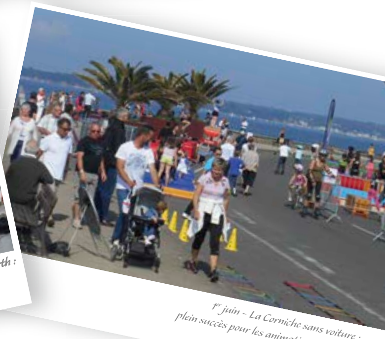
7 er juin - La Corniche sans voiture : plein succès pour les animations sportives.