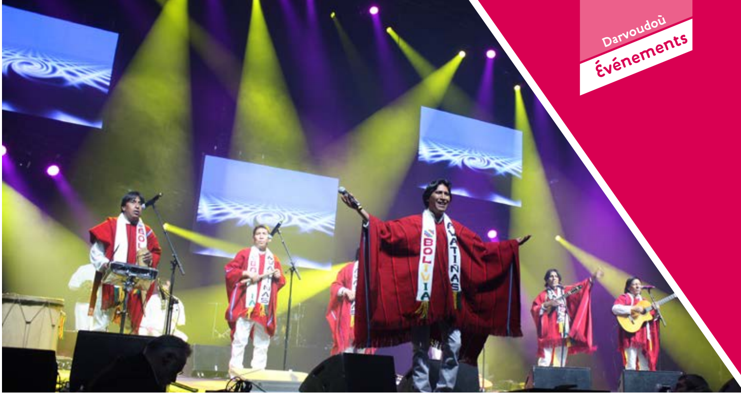
Le groupe bolivien Awatinas