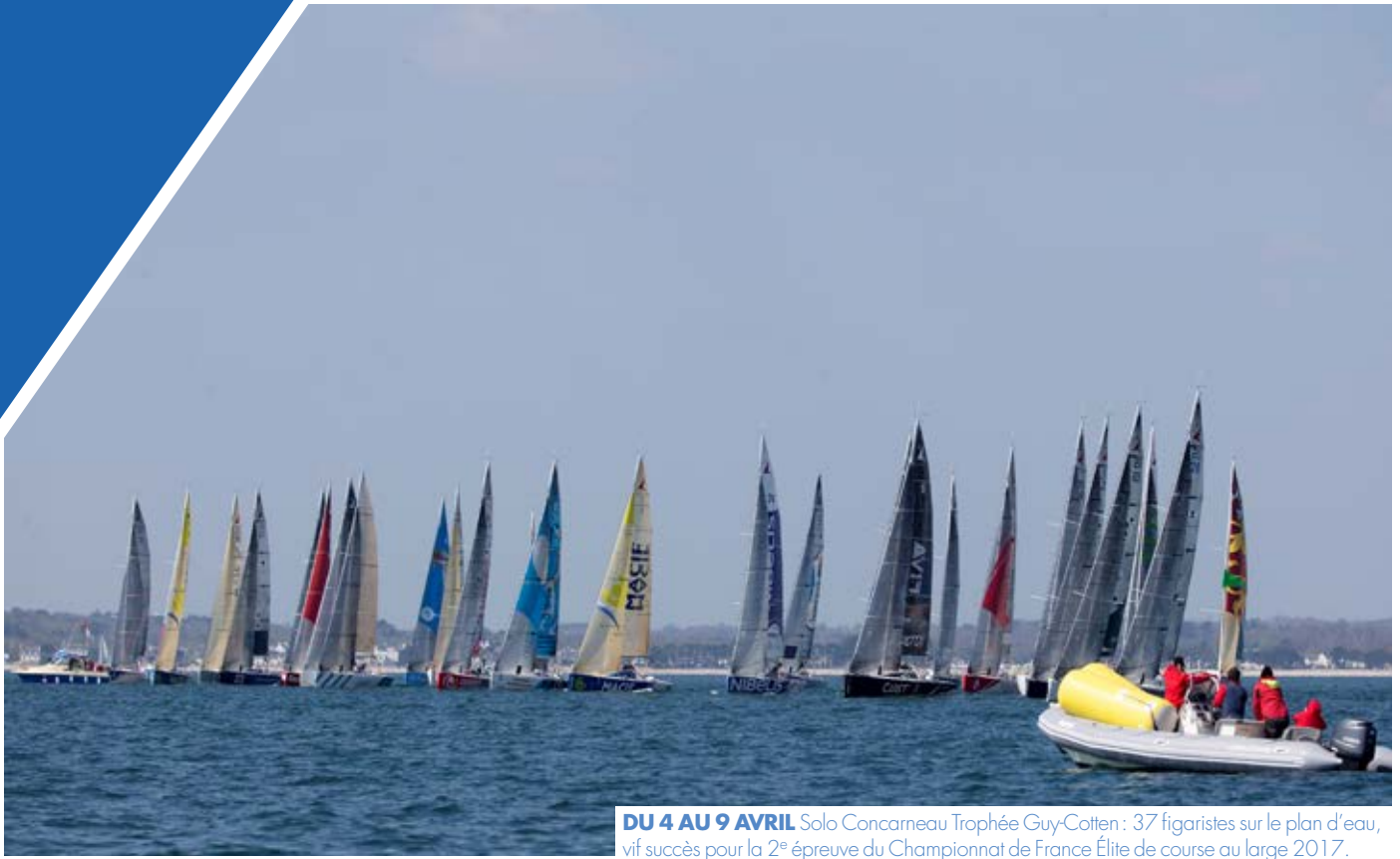
DU 4 AU 9 AVRIL Solo Concarneau Trophée Guy-Cotten : 37 figaristes sur le plan d'eau, vif succès pour la 2 e épreuve du Championnat de France Élite de course au large 2017.