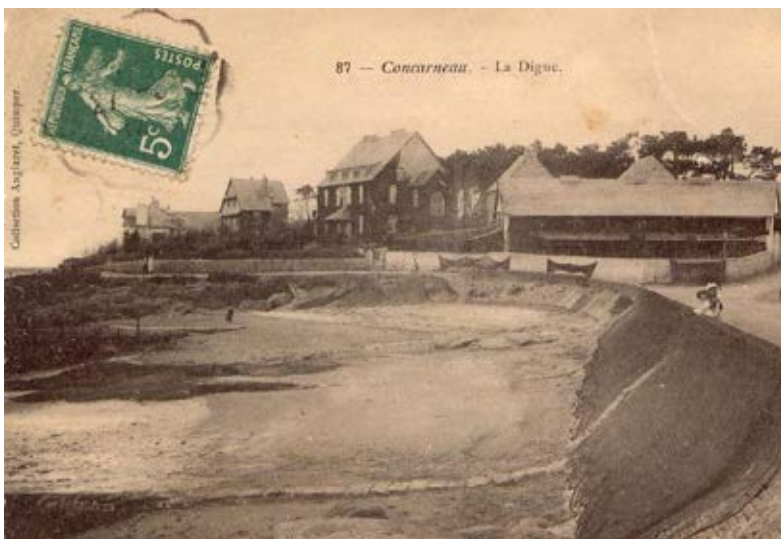
Plage Rödel - 1 re moitié du XX e siècle