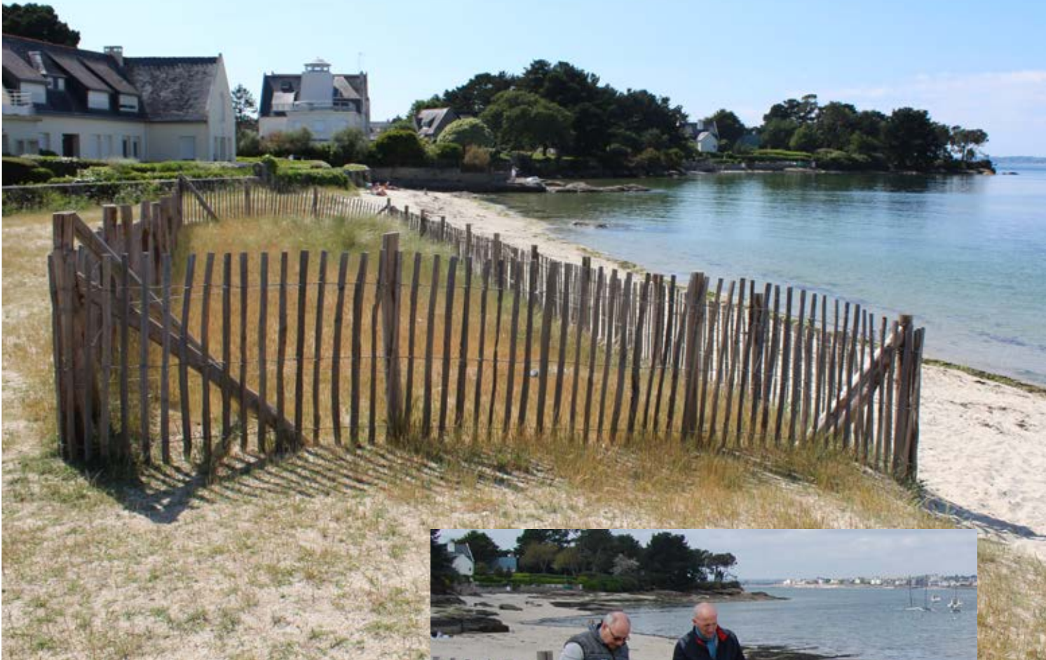
Plage de la Belle-Étoile : 3 zones tests sur la dune, entourées de ganivelles.

cette démarche environnementale », commente Nicolas Bernard. En jeu, la réduction des émissions de gaz à effet de serre. L'appariteur, les agents d'astreinte du service des Bâtiments et le personnel des Espaces verts devraient être les premiers à rouler dans ces voitures propres qui représenteront 20 % du parc.