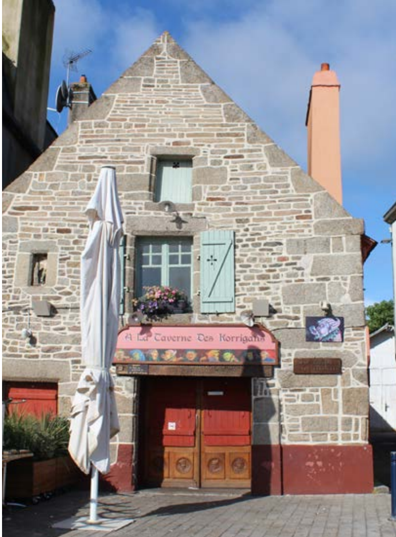
La taverne des Korrigans