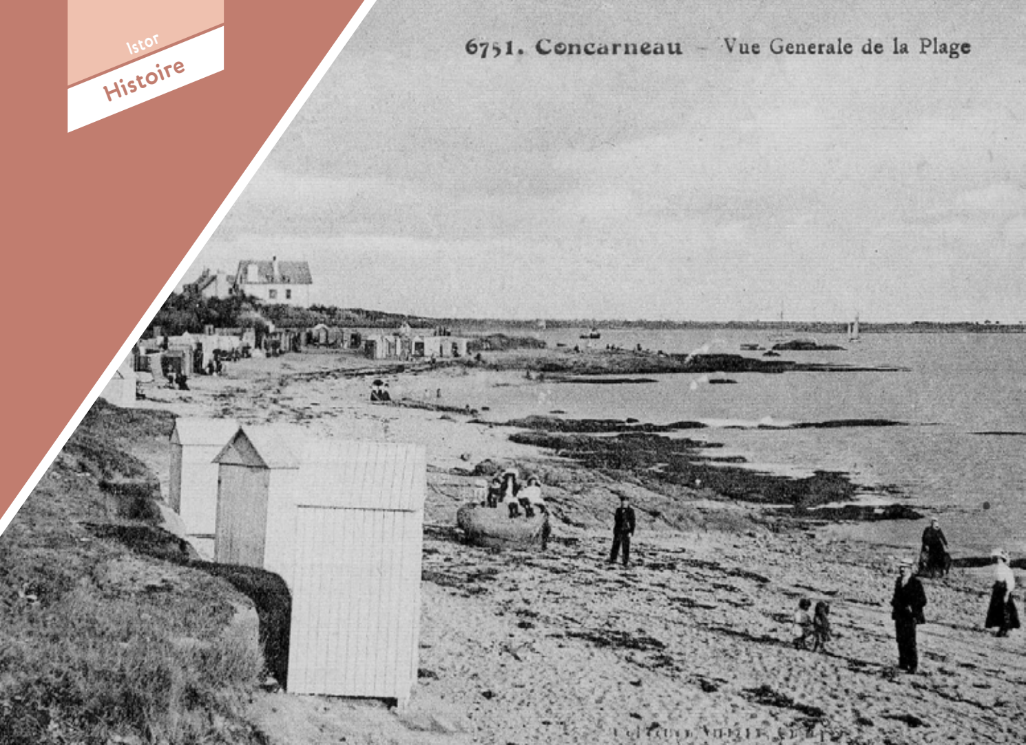
Plage des Sables blancs - 1 re moitié du XX e siècle