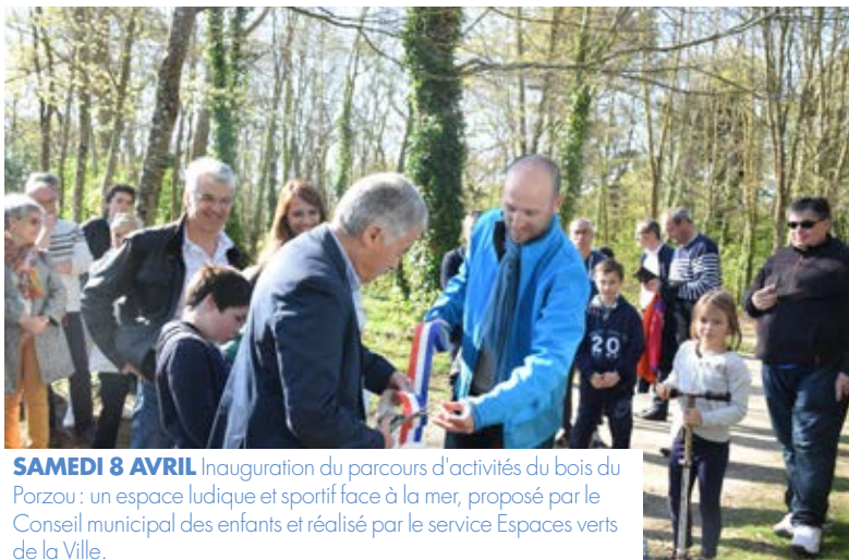
SAMEDI 8 AVRIL Inauguration du parcours d'activités du bois du Porzou : un espace ludique et sportif face à la mer, proposé par le Conseil municipal des enfants et réalisé par le service Espaces verts de la Ville.