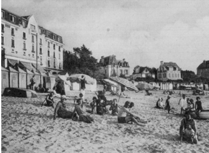
Plage de Cornouaille - 1 re moitié du XX e siècle