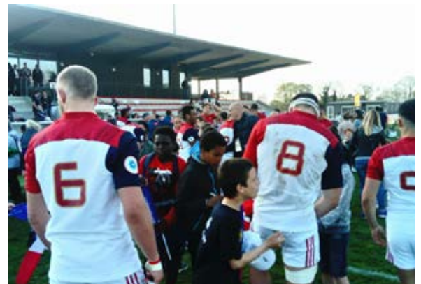
DU 7 AU 15 AVRIL Championnat d'Europe de rugby des moins de 18 ans : le stade Henri-Sérandour a accueilli plusieurs rencontres de cette compétition, une belle occasion de faire découvrir le haut niveau aux jeunes pratiquants.