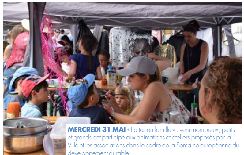
MERCREDI 31 MAI « Faites en famille » : venu nombreux, petits et grands ont participé aux animations et ateliers proposés par la Ville et les associations dans le cadre de la Semaine européenne du développement durable.