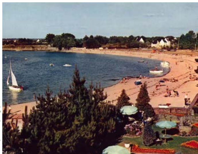
Plage de la Belle Étoile - 3 e quart du XX e siècle

tout débarquement. Une équipe de nettoyeurs finira de les arracher en 2014.