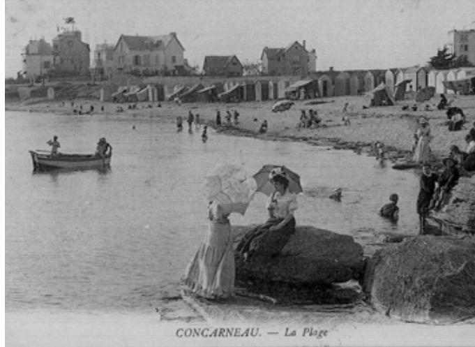
Plage des Dames - 4 e quart du XIX e siècle