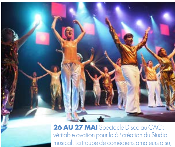
26 AU 27 MAI Spectacle Disco au CAC : véritable ovation pour la 6 e création du Studio musical. La troupe de comédiens amateurs a su, une nouvelle fois, conquérir le cœur du public.