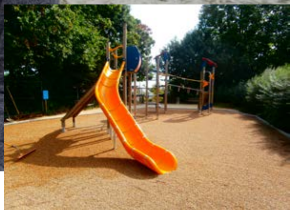
L'aire de jeux de Kerauret rénovée.